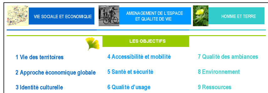
Schéma 3: Dimensions et objectifs du HQE route Durable

Ces dimensions sont schématiquement construites à partir de différents angles d'analyse de la relation entre la route et les territoires chacun explicités par leur intitulé : la relation à la globalité du territoire, la relation à la vie locale ainsi que la relation aux individus et à leur environnement.