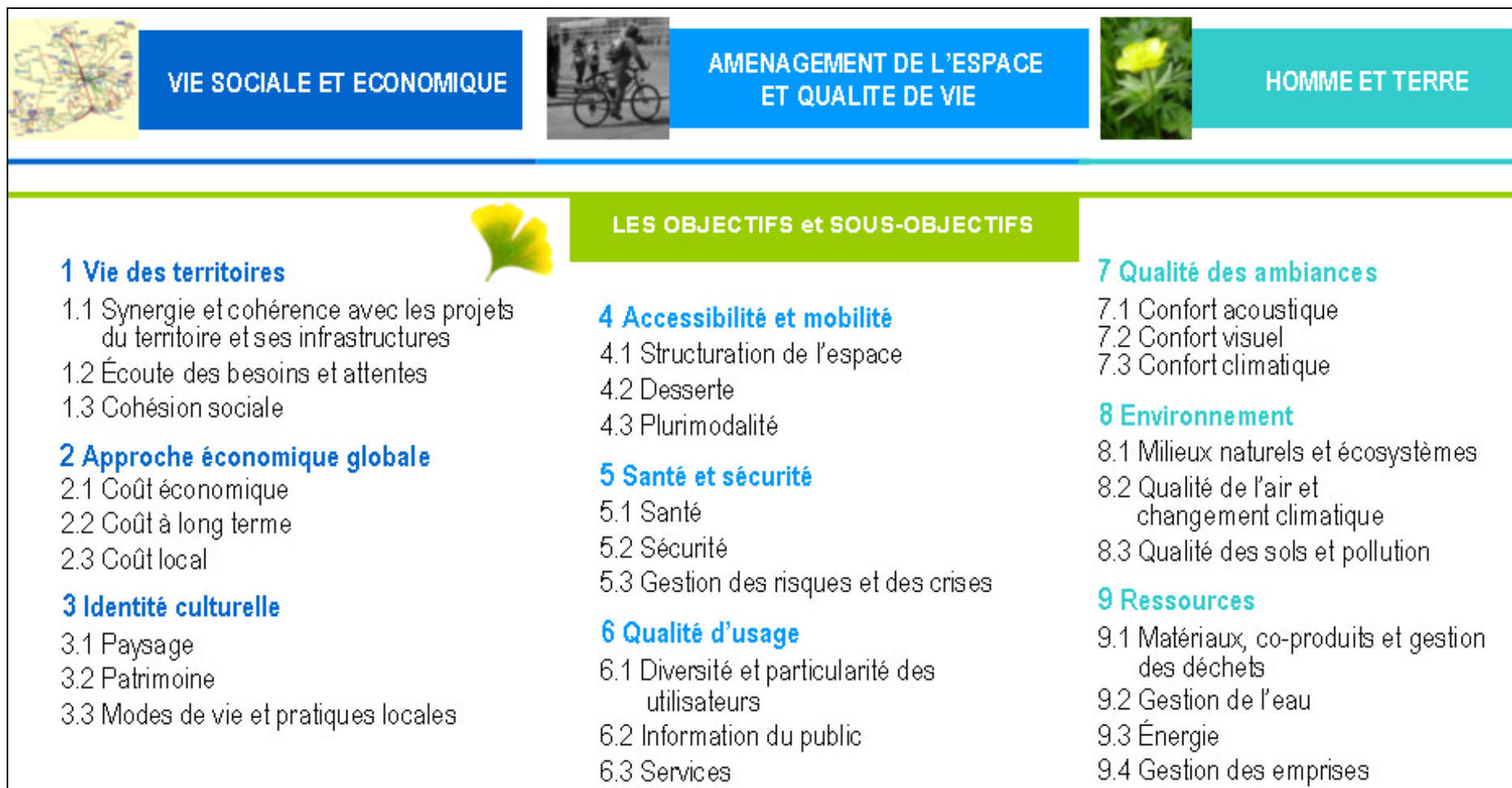
Schéma 5: Dimensions, objectifs et sous-objectifs du HQE Route Durable